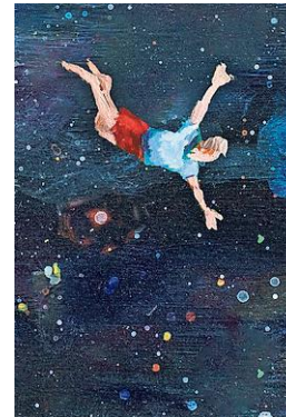
Een van de 180 schilderijtjes die ten grondslag liggen aan 'Perpetuum'.

ken zijn net als een mooie zonsopgang. Dat spel met licht en donker, dat raakt je, daar wil je bij zijn. Ik ben dan ook blij dat we als gemeente dit initiatief omarmd en ondersteund hebben.”